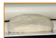
Introduction façonneuse dans le bon sens