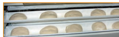
Chargement gouttières : 5 pâtons 500 g