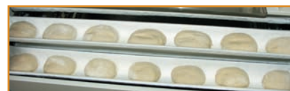
Chargement gouttières : 7 pâtons 350 g